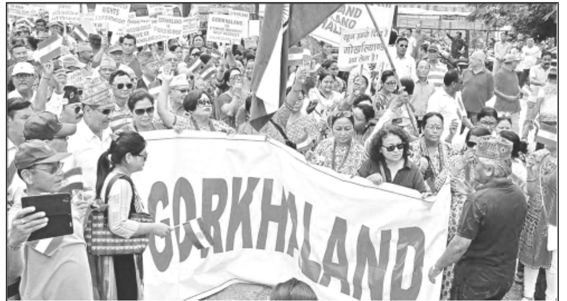
गोरखालैंडको मांगलाई लिएर आइतवार परेड ग्राउण्डमा रैली निकालदै गरेका गोरखा समुदायका सदस्यहरू

हाम्रो चिनेरी गोरखा, लिएर रहौंला गोरखालैंड गोरखाली सुधार सभाको बैनर मुनि प्रदेशका गोरखाहरू गोरखालैंड न बने सम्म चैनको सांस लिने छैनौं