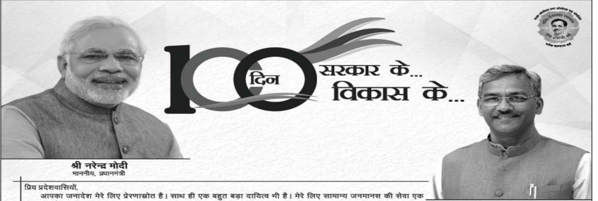
श्री नरेन्द्र मोदी माननीय, प्रधानमंत्री

प्रिय प्रदेशवासियों, आपका जनादेश मेरे लिए प्रेरणास्रोत है। साथ ही एक बहुत बड़ा दायित्व भी है। मेरे लिए सामान्य जनमानस की सेवा एक रामकाज है।