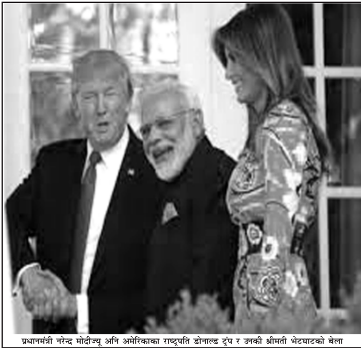
प्रधानमंत्री नरेन्द्र मोदीज्यू अनि अमेरिकाका राष्ट्रपति डोनाल्ड ट्रंप र उनकी श्रीमती भेटघाटको बेला

व्हाइट हाउसमा मोदी र ट्रम्पको चिर प्रतिक्षित मिलन हाए कार्यालय